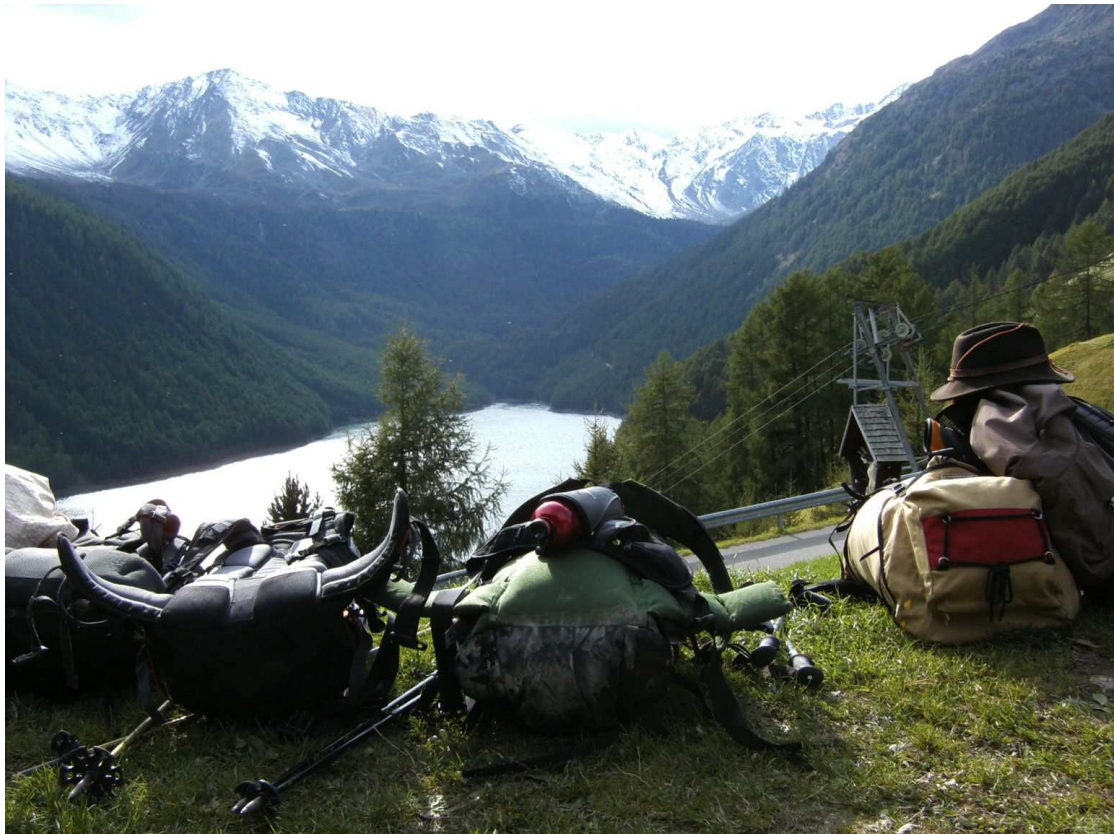
(Am Tiesenhof heißt es dann endlich: Rucksäcke `runter ... - 26.09.2008)