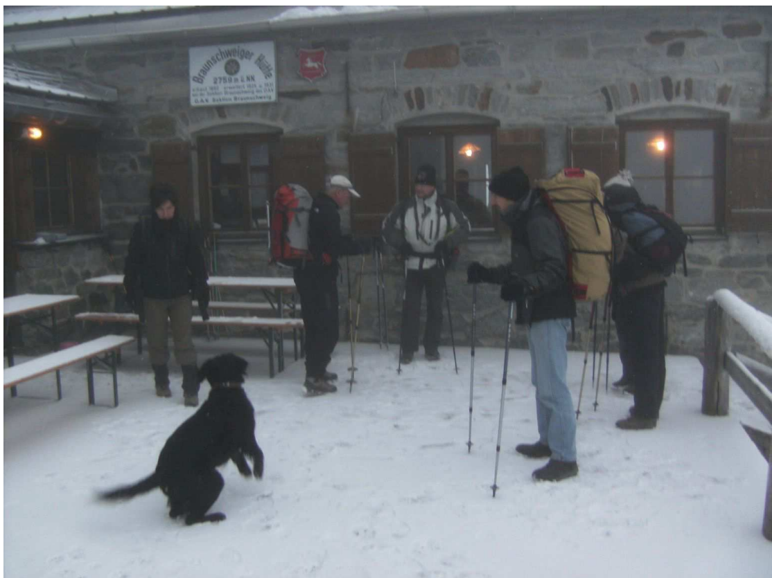
(... mit der sich wandelnden Umwelt ... - 25.09.2008)

Notwendigkeiten verschieben sich - das Gefühl in der Situation zählt bewusster mit ...