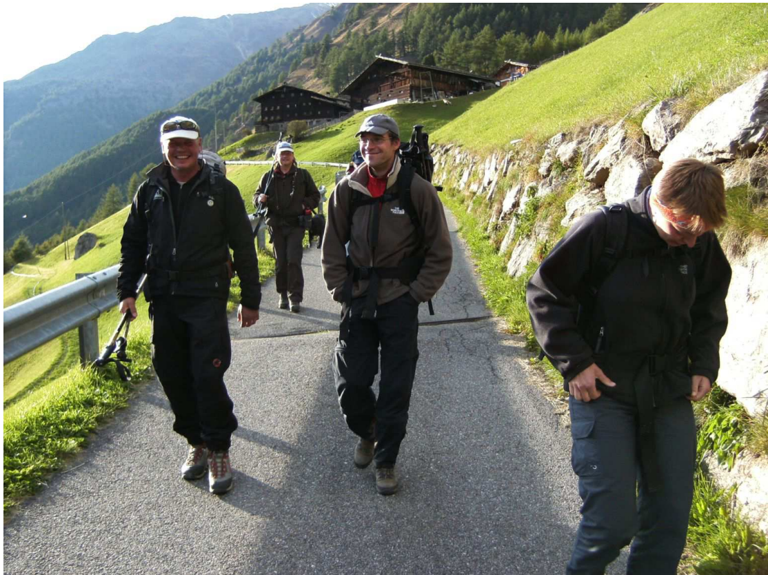
(Ein letzter - entspannter - Spaziergang hinunter nach Obervernagt, ... - 26.09.2008)