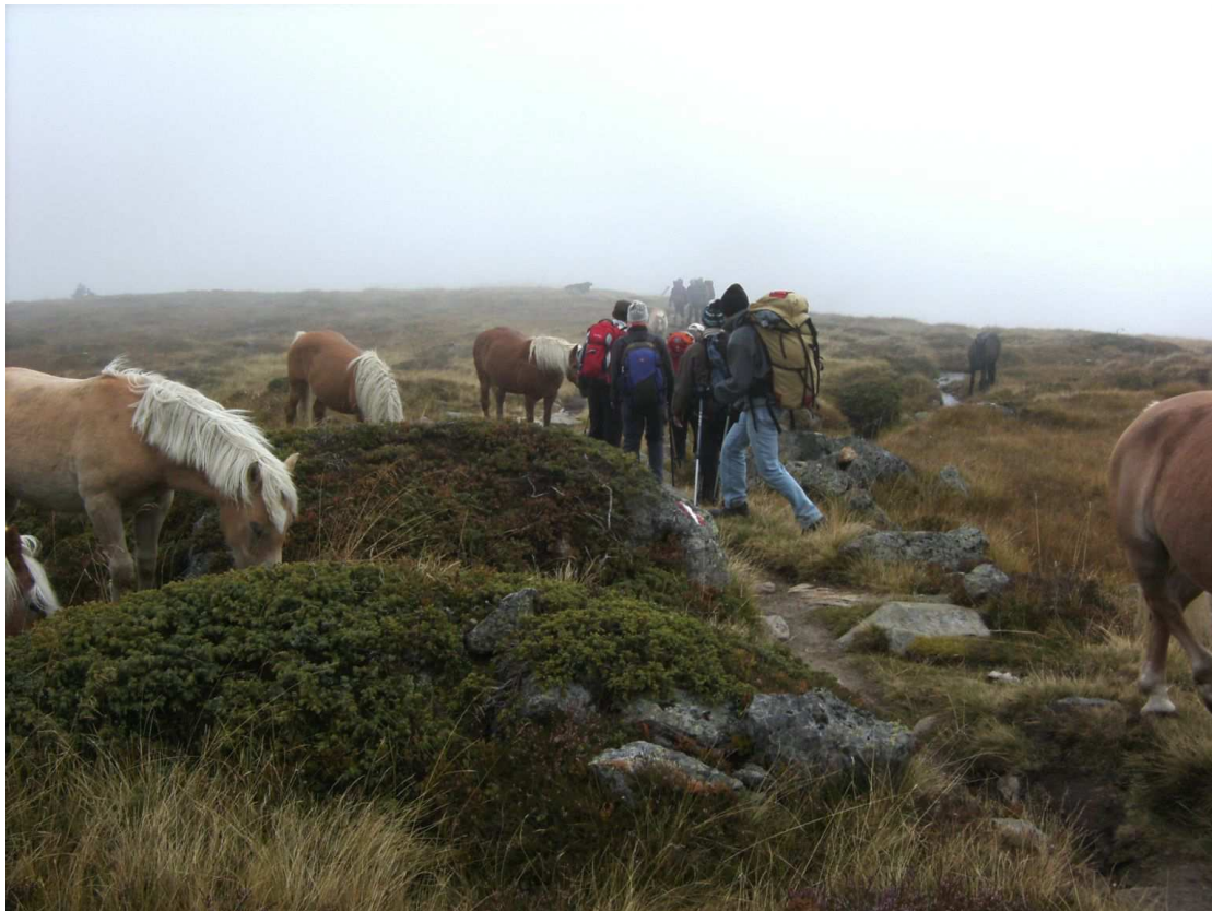
(Pferde sind die ersten Anzeichen der wiederkehrenden Zivilisation ... - 25.09.2008)

Ein Wellness-Hotel steht auf dem Plan ...