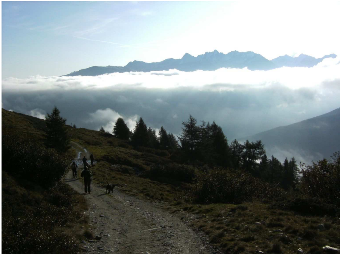
(Über den Wolken: Der morgendliche Abstieg von der Galflun-Alm ... - 24.09.2008)