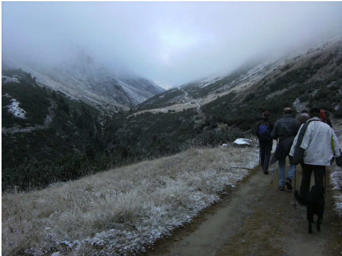
(Der letzte Aufstieg: Es geht hinauf zur Similaunhütte ... - 26.09.2008)