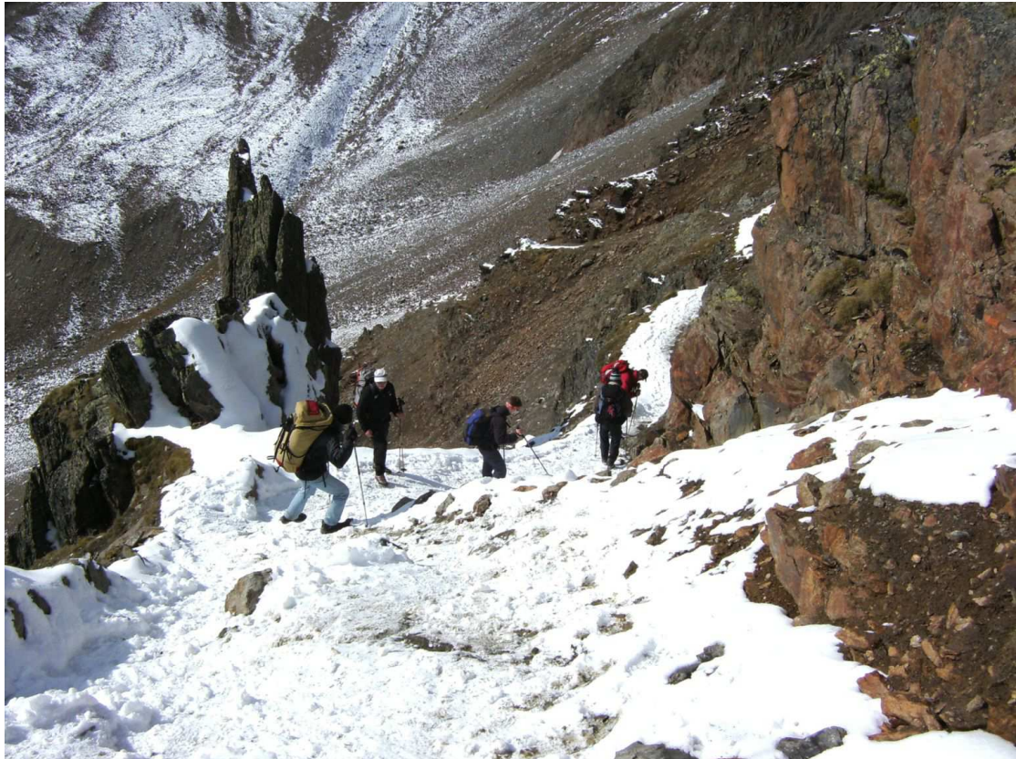
(Dann geht's bergab, hinab nach Südtirol, hinein nach Italien ... - 26.09.2008)