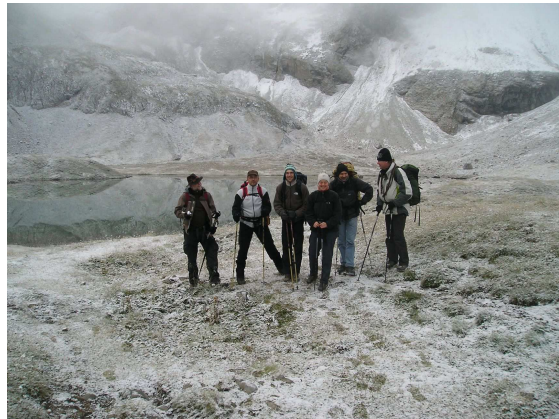
(... und wir dabei ... - 23.09.2008 - w.L.)