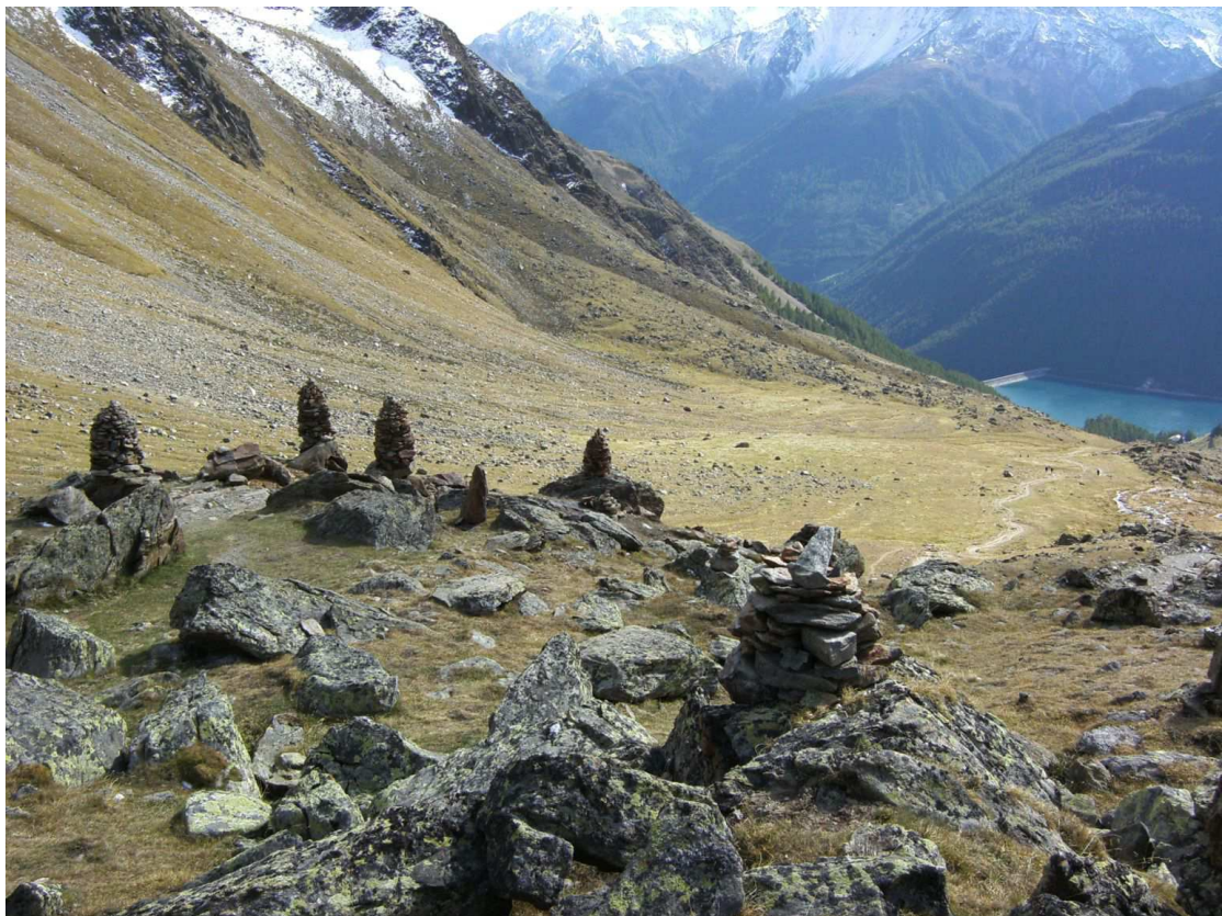
(... wo sich alte und neue Baukunst begegnen ... - 26.09.2008)

Wir steigen ab und unser Gefühl steigt an ...