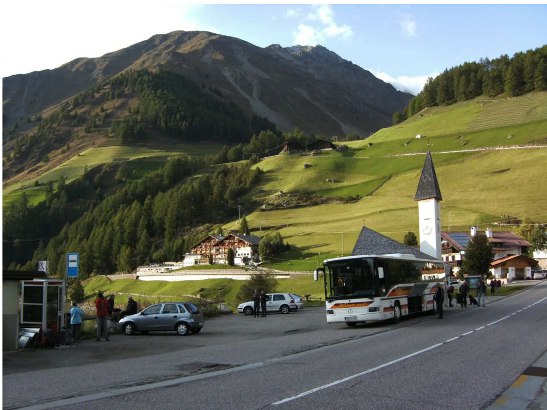
(... denn dort wartet schon der Bus nach Meran ... - 26.09.2008)

Das Ende der Tour rückt leider unaufhaltsam näher und näher ...