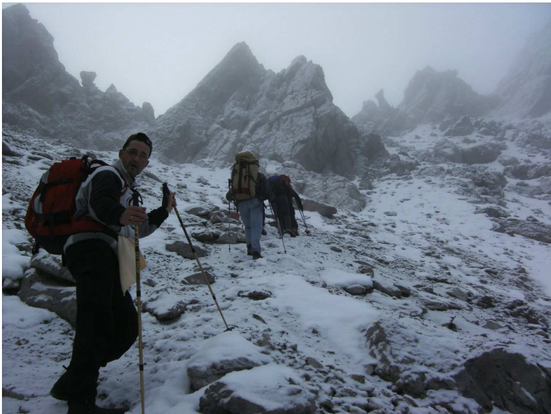
(... und dann der geradezu unheimliche Aufstieg zur Seescharte ... - 23.09.2008)

Schritt für Schritt konzentriert voran ...