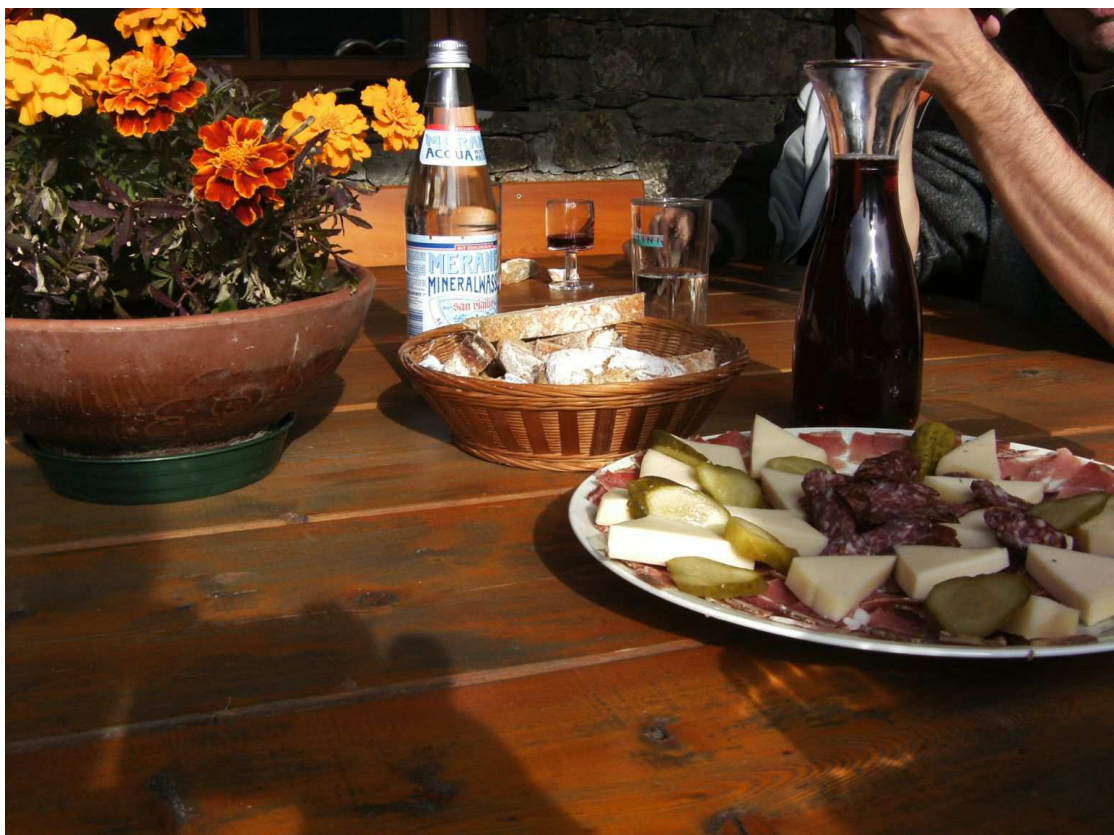
(... und `ran an den Speck ... - 26.09.2008)

Essen und Trinken halten bekanntlich Leib und Seele zusammen ...