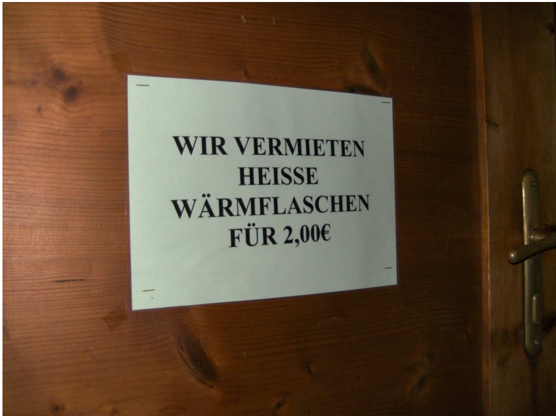
(Der Stellenwert der Dinge ändert sich ... - 24.09.2008)