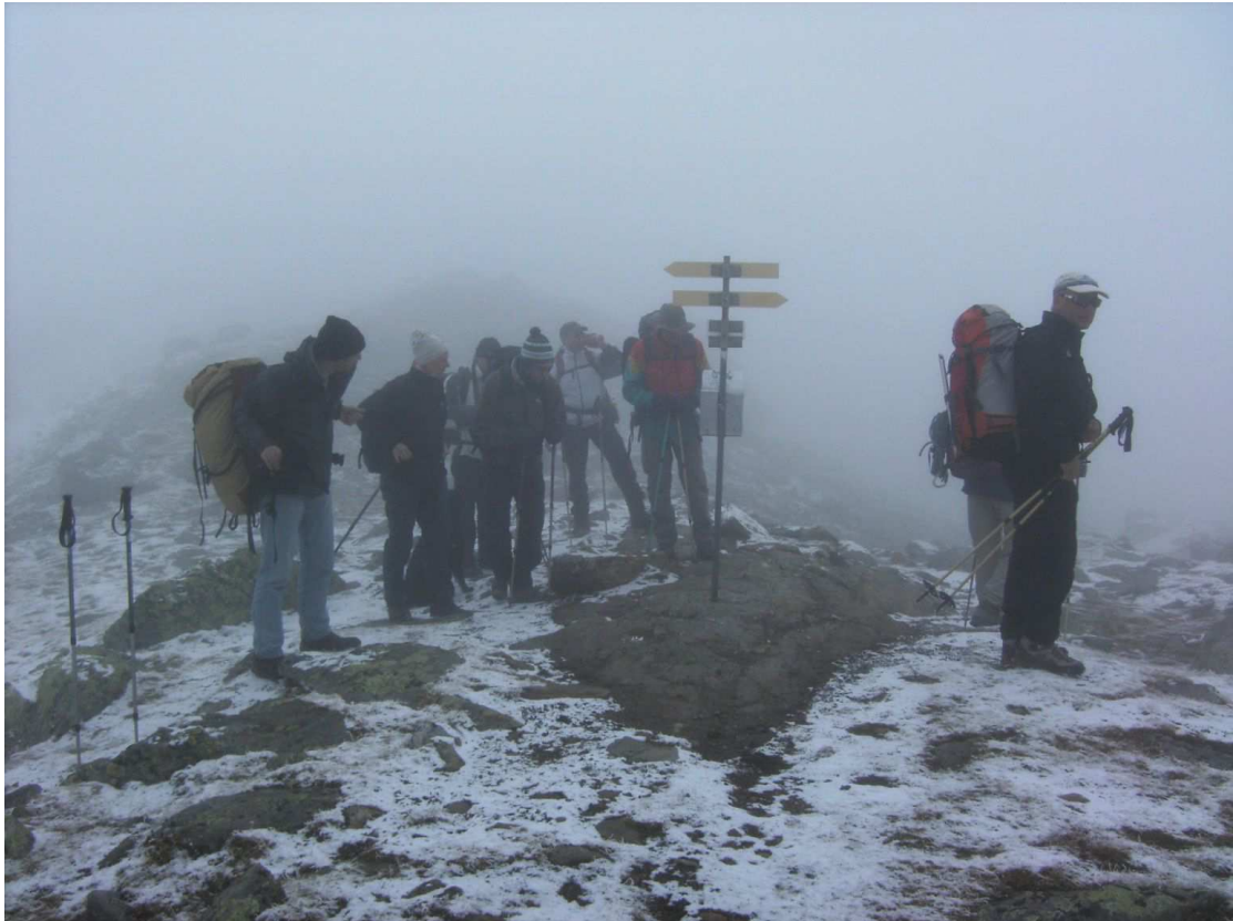
(Nebel und Wolken führen zur Konzentration auf uns selbst ... - 25.09.2008)