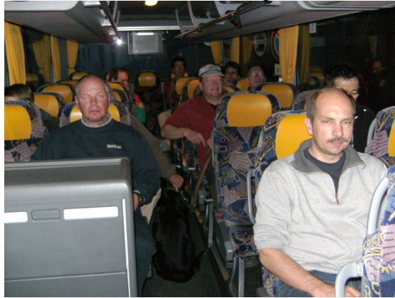
(... und morgendliche Rückfahrt ...)