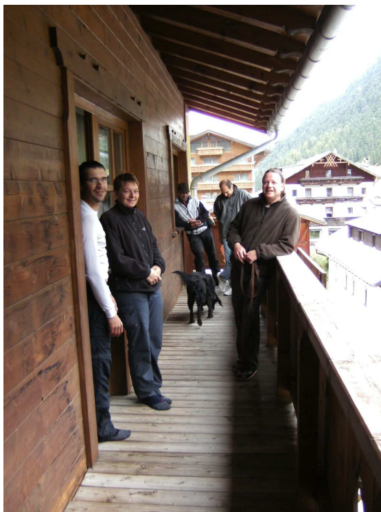
(Im Hotel "Post" in Vent - 25.09.2008)

Ein Wellness-Hotel steht auf dem Plan ...