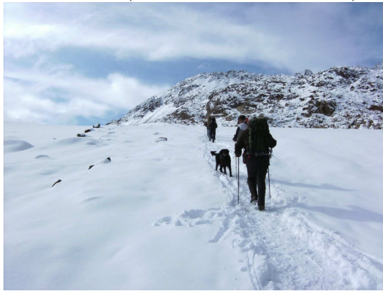
(... und erobern die Höhe ...)