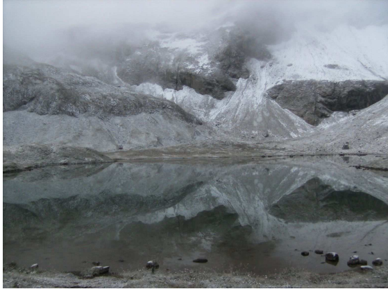
(Die Gebirgswelt im Spiegel des Sees an der Memminger Hütte ...)