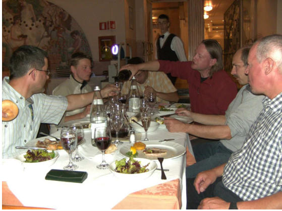
(Abendlicher Ausklang in Meran ...)