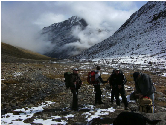
(Wir verlassen das Tal ...)